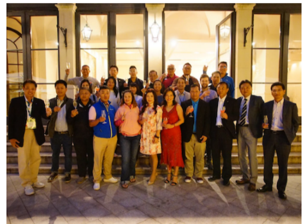
2017年ゴルフ旅行関係者招聘